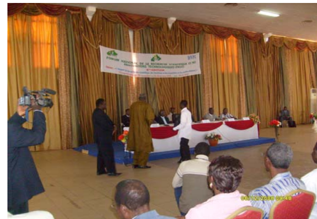
Cérémonie officielle de remise des prix lors du FRSIT 2008

N.B. : le texte intégral de la communication doit obligatoirement être remis au secrétariat du SP le jour de la présentation sur clé USB