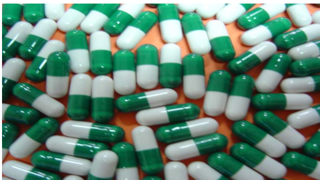
FACA : Produit contre les crises de drépanocytose (IRSS/CNRST)